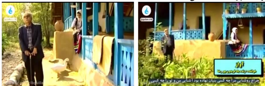
تصویر ۲: پخش ویدئوی آواز عزیز نگاری توسط صدا و سیمای گیلان.

— اسطوره‌کاوی الگوی عشق در فرهنگ مشترک گیلان و منطقه الموت (نمونه موردی روایت عزیز و نگار) آب زمزم و صابون تهران». گفتنی است آوازه‌های عزیزنگاری بسیار سوزناک است و تنوع زیادی در دامنه و ارتفاعات رشته کوه البرز دارد. تصور ۲، نمایی از پخش ویدئویی است که آواز عزیزنگاری را در صدا و سیمای استان گیلان به خوانندگی فریدون پوررضا نشان می‌دهد..