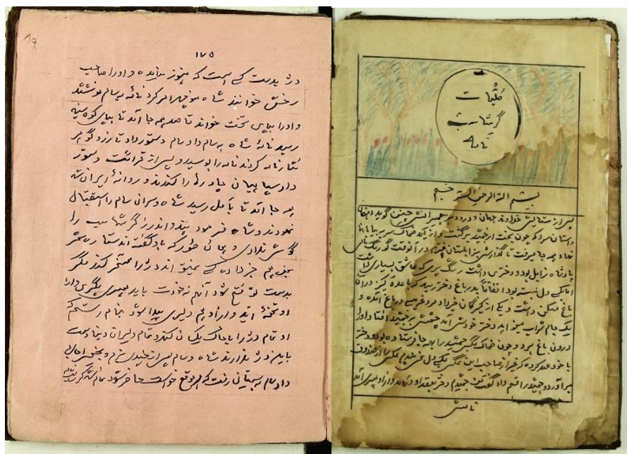
تصویر ۱- راست: صفحه آغازین متن اصلی (پس از صفحه عنوان)؛ چپ: صفحه پایانی متن

«شاه و سام پس از چندی بزم و نخچیر اجازه داد سام به سیستان رفت که هر موقع خواست حاضر شود. تمام شد گرشاسب نامه». چند برگ آخر را هم از تاریخ سیستان نقل می کند که می توان آن را ضمیمه کلیات گرشاسب نامه دانست.